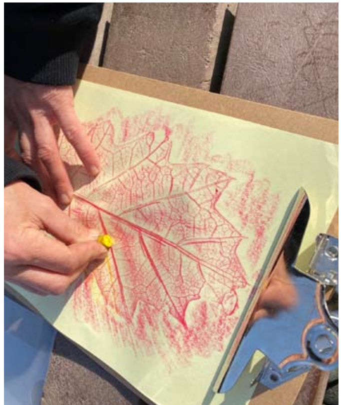
Aardmannetjes in de weer met herfstbladeren