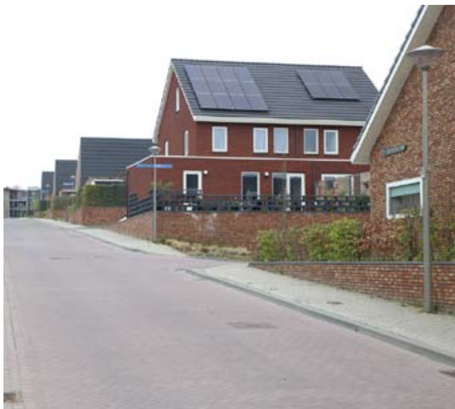
Er zijn nog genoeg daken vrij voor zonnepanelen.