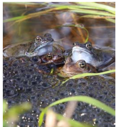
Parende bruine kikkers

Ook deze poel werd geïnventariseerd, er werd een aantal gewone padden en bruine kikkers gevonden. Ook deze zorgden voor voortplanting d.m.v. eisnoeren en eiklumpen. Ook werden enkele groene kikkers gezien. Echter, het waterniveau daalde dramatisch in 2020. Dit zou o.a. veroorzaakt kunnen worden door de droogte en eerdere werkzaamheden aan de Drulse beek. Ook dreigde de poel dicht te groeien door met name lisdodden. Vandaar dat de gemeente Berg en Dal op 29 november op verzoek van de WMG de poel heeft ontdaan van de lisdodden en sliblaag.