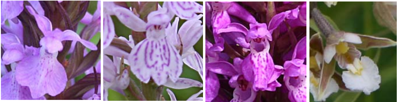
Bloemen van orchideeën zijn voor insecten bijna onweerstaanbaar. Van links naar rechts: Rietorchis, Gevlekte ochis, Brede orchis en Moeraswespenorchis