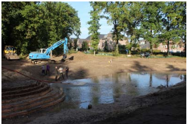
De Koepel loopt weer vol

In oktober 2019 werd eindelijk begonnen met de aanleg van de nieuwe Koepel. Er werd een nieuwe leemlaag aangebracht die flink werd aangestampt om hem waterdicht te maken. Ook werd een nieuw kunstmatig eiland aangelegd. Eenmalig werd de vijver weer gevuld met water van Vitens. Al snel bleek echter dat het water helaas toch weer zakke, met wel enkele centimeters per dag. Men vermoedde dat de leemlaag toch nog een beetje poreus was en dat die minieme gaatjes vanzelf dicht zouden gaan. Om te voorkomen dat het water teveel zou dalen, werd een pomp geïnstalleerd die grondwater oppompte. Langzaam zette de leem zich en werd de daling minder en hoefde de pomp steeds minder aan te slaan en bleef de Koepel mooi vol. Hiermede werd de voortplantingsplaats voor de amfibieën weer hersteld. De WMG heeft een financieel bijgedragen aan dit natuurherstelproject.