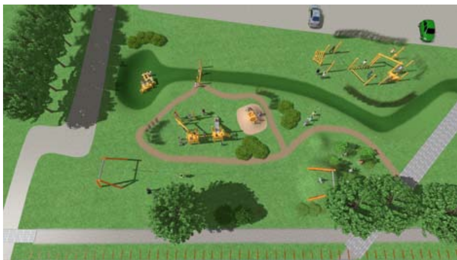
Ontwerp Speeltuin Kerkstraat

Op initiatief van een groepje ouders is het plan gelanceerd om op de groenstrook van de Kerkstraat een speeltuin te maken. De gemeente heeft daar positief op gereageerd, maar van veel omwonenden kwam protest omdat men bang was voor overlast. Ook de WMG was kritisch, meer op de inpassing van de speeltuin dan op het principe. In het eerste plan waren de vele toestellen erg groot, waardoor ze grote invloed zouden hebben op de beleving van de omgeving (kerkje) en groenstrook. De WMG heeft deelgenomen aan mediationgesprekken die op initiatief van de gemeente met bezwaarmakers werden gehouden. Op grond daarvan is het ontwerp sterk aangepast waardoor de landschappelijke inpassing beter werd. De speeltuin is inmiddels gerealiseerd, is niet meer erg dissonant en er wordt veel gebruik van gemaakt.