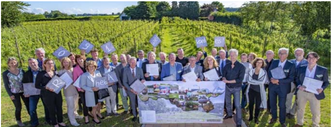
Deelnemers aan RAS

zienswijze over hoe dat veel beter zou kunnen, met meer rendement voor natuur, landschap en ook mens (klimaatadaptatie). Helaas heeft de gemeente ons verwezen naar het waterschap.