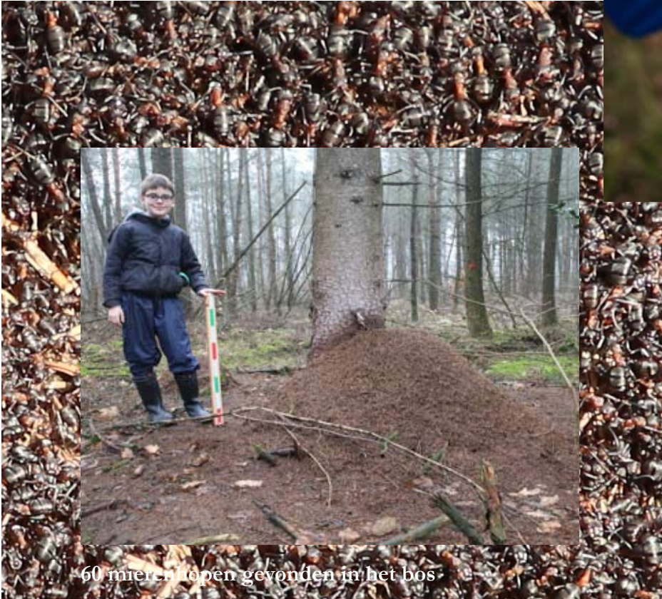
60 mierenlopen gevonden in het bos