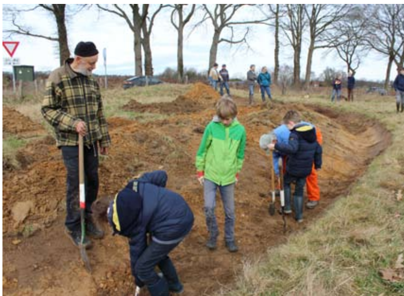
Aanleg van de 'hidden hedge' nabij de Wylerbaan

Landschapsbeheer Groesbeek (LBG) is de afdeling binnen de Werkgroep Milieubeheer Groesbeek waarin vooral praktisch werk wordt verricht op het gebied van onderhoud en beheer van het landschap. Een keer per maand, op zaterdag tussen 9.00 en 13.00 uur steken de vrijwilligers de handen uit de mouwen. De werkzaamheden bestaan o.a. uit het snoeien van struweel, het knotten van bomen, het plaggen van bermen en maaien en hooien op die plaatsen waar geen landbouwmachines kunnen of mogen komen.