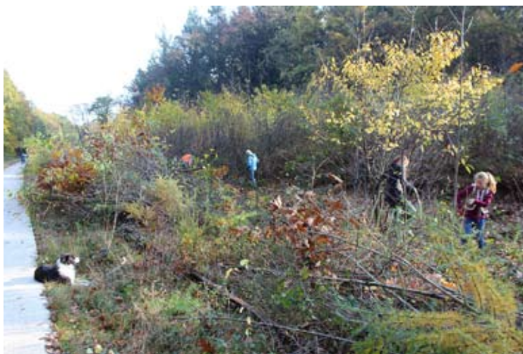
Tijdens de landelijke natuurwerkdag werd gewerkt in de spoorkuil

In 2017 zijn er meer dan 40 zandhagedissen en ook 4 hazelwormen gesneuveld op het fietspad door de spoorkuil. In het Maatregelenplan fietspad spoorkuil (medio 2016 overeengekomen tussen gemeente, WMG en Ravon), dat een einde maakte aan het slepende conflict met de RVO, is afgesproken dat er bij meer dan 15 doodgereden zandhagedissen in een seizoen overleg komt over aanvullende maatregelen ter voorkoming van meer slachtoffers. Voor de RVO was daarmee de kous af. Helaas is het nog niet gelukt om met de gemeente aanvullende beschermende maatregelen in de spoorkuil af te spreken.